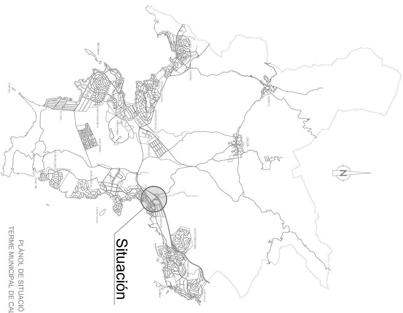
PLÀNOL DE SITUACIÓ TERME MUNICIPAL DE CALVIÀ