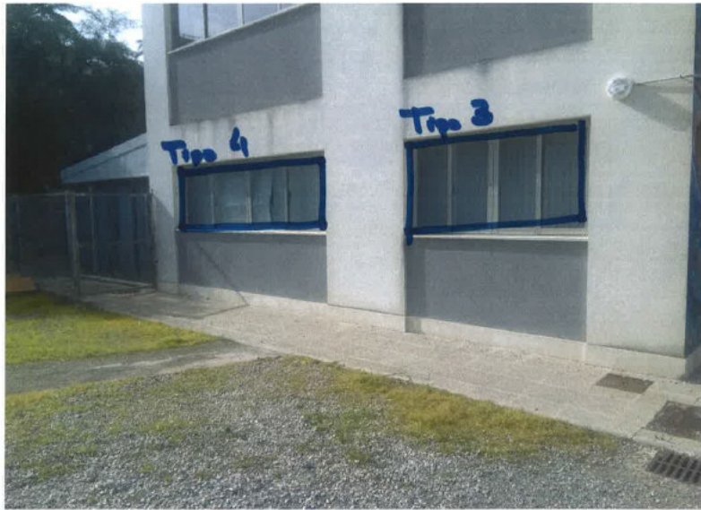
T3: 2,24 x 1,19