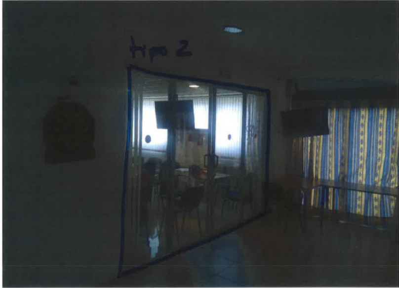
T2. : 3,63 x 2,38