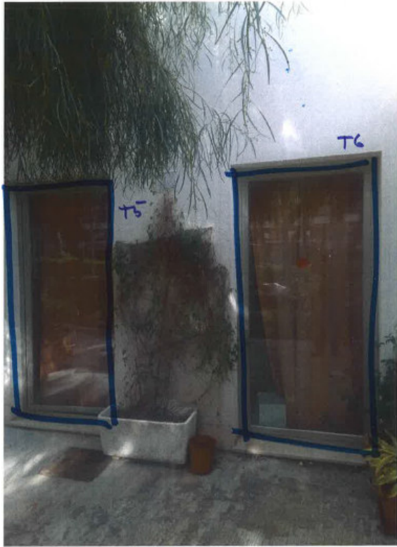
T5: 1,618 x 2,40