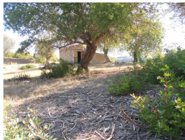
Vista caseta des d'emplaçament sanitari portàtil