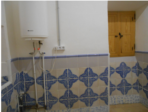
PORTA A RETIRAR (PORTA DE LA DRETA)