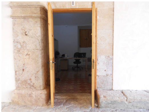
Porta d'entrada a ofcina anterior a la sala de bany