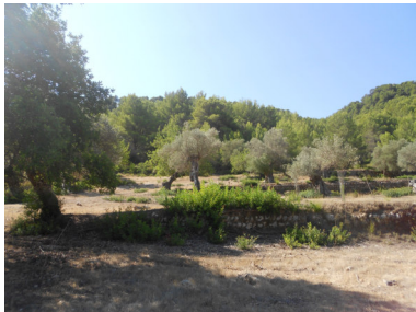
Emplaçament sanitari portàtil