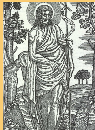
Imatge de sant Joan en una estampa del primer terç del segle XIX publicada per Joan Amades en el seu Costumari català .

La festa de Sant Joan se celebra el 24 de juny, just després del solstici d'estiu, que marca l'inici de la nova estació. És l'època en què les nits són les més curtes de l'any i els dies els més llargs, el moment en què el Sol és en el seu punt més alt. Segons la llegenda, el Sol celebra el seu sant aquest dia, i com que és el rei i senyor del cel, ell, la Lluna i els estels estan de festa grossa. També es diu que per aquest temps s'encén una gran foguera al cel que precipita i accelera la creixença de tots els fruits.