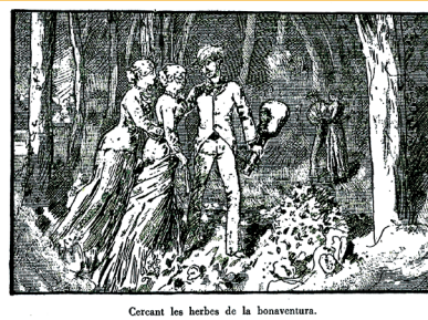
Cercant les herbes de la bonaventura.

«Cercant les herbes de la bonaventura». Gravet publicat per Joan Amades en el seu Costumari català .