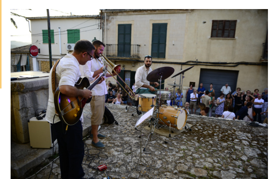
Interpretació musical a damunt l'Aljub Vell de Calvià en ocasió del JoanArt 2017.

D'ençà l'any 2016, entre els actes festius del dia del patró del poble, l'Ajuntament de Calvià organitza el que es coneix com a «JoanArt», una celebració que ofereix al públic exposicions d'art i altres mostres d'activitats artístiques pels carrers i altres espais de la Vila, en combinació amb actuacions musicals i gastronomia. Tot i la seva curta trajectòria, el JoanArt ja ha esdevingut un referent en el calendari festiu i cultural del municipi.