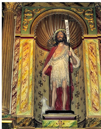
Imatge de sant Joan Baptista que presideix el retaule major de l'església de Calvià.