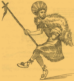
Imatge de sant Joan Pelós publicada per Joan Amades en el seu Costumari català .