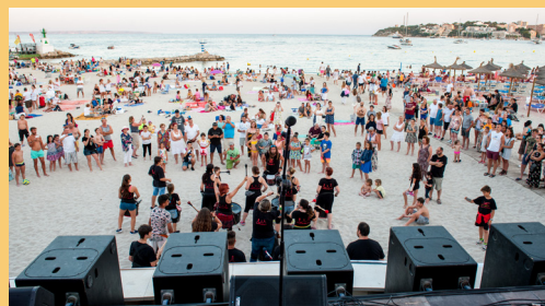
Concert de la revetlla de Sant Joan a la platja de Palmanova

Un altre costum entre el poble propi d'aquesta celebració era anar a fer bany i ablucions a les fonts, els rius i les platges, perquè es creia que aquest dia les aigües tenien virtuts especials.