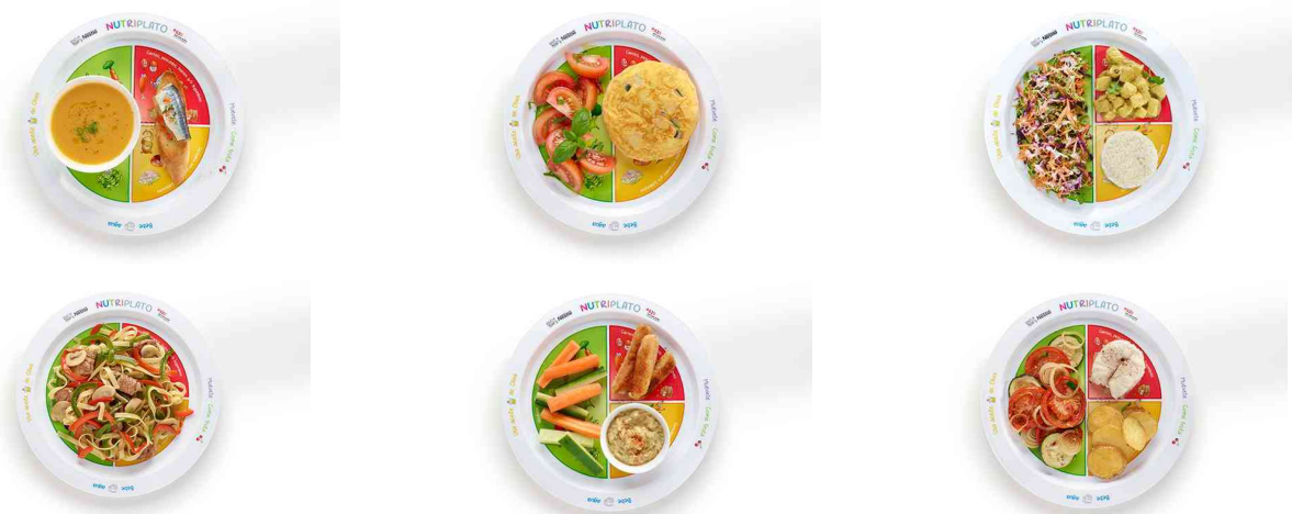
Imágenes de nutriplato ( www.nutriplatonestle.es )

A partir de aquí, podemos obtener una gran variedad de elaboraciones, presentaciones y combinaciones para hacer que nuestra alimentación diaria sea lo más variada y atractiva posible.