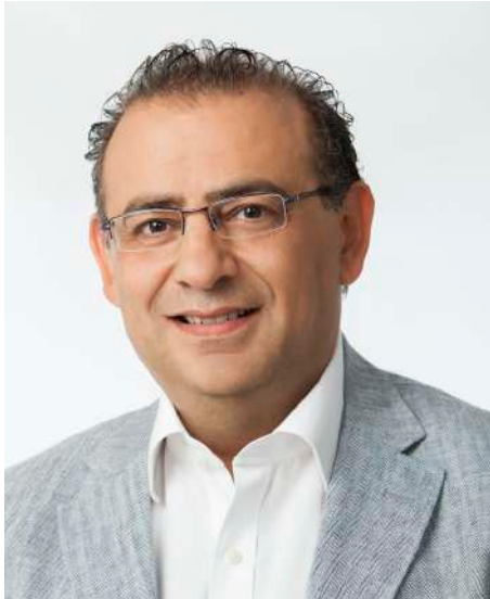
Alfonso Rodríguez Badal Batle de Calvià Alcalde de Calvià