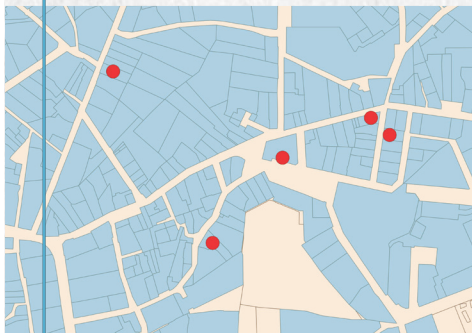
Escoles de nines a Calvià