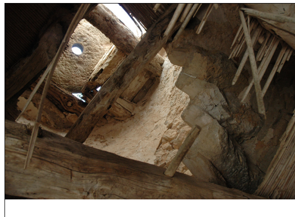
Descripción: Vista del piso superior y la mola.