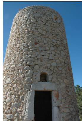
Descripción: Torre, puerta y nicho del molino.