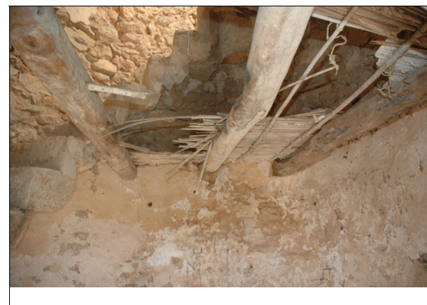
Descripción: Interior, escalera y envigado de la torre del molino.