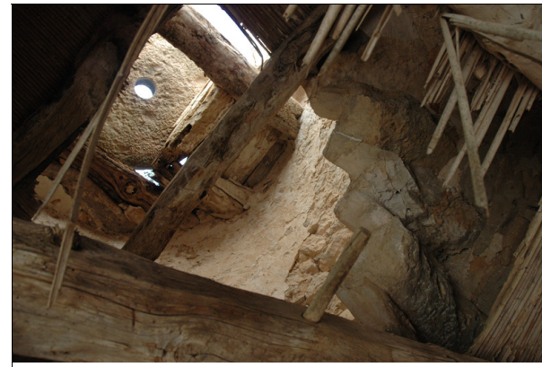
Descripción: Vista del piso superior y la mola.