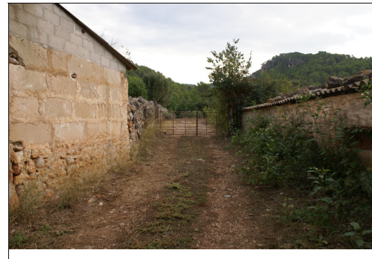
casas segunda barrera