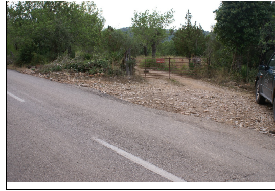
Entrada desde la carretera