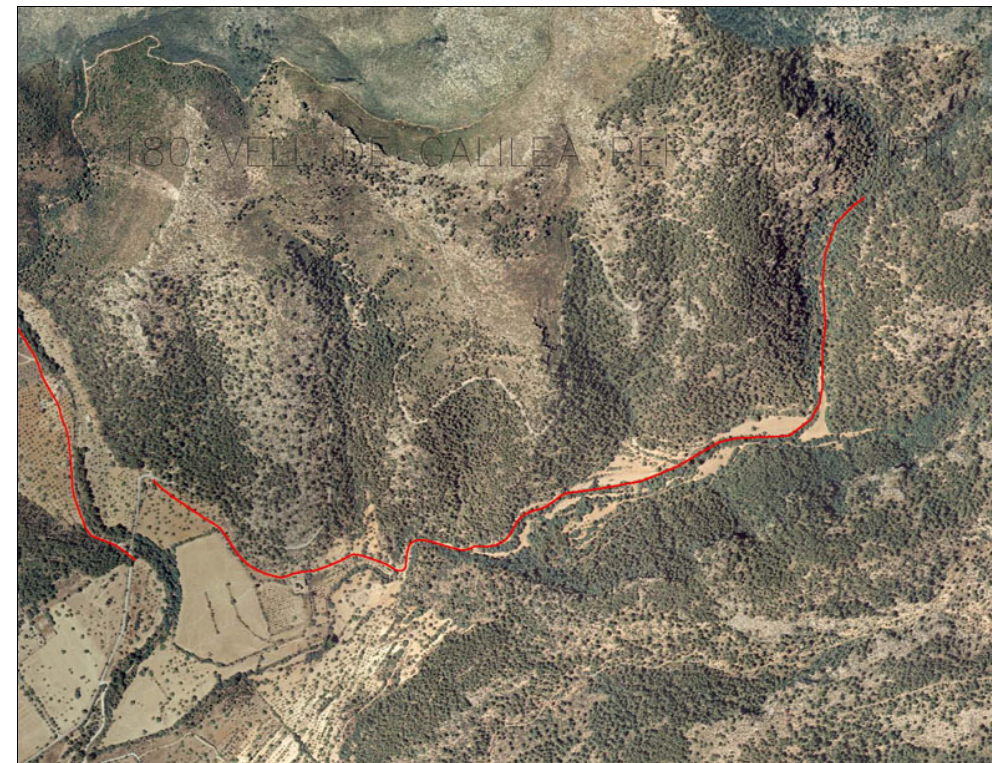
Delimitación del conjunto