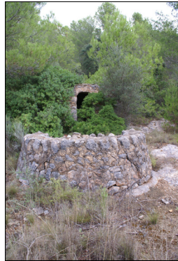
Granero del diezmo en el camino