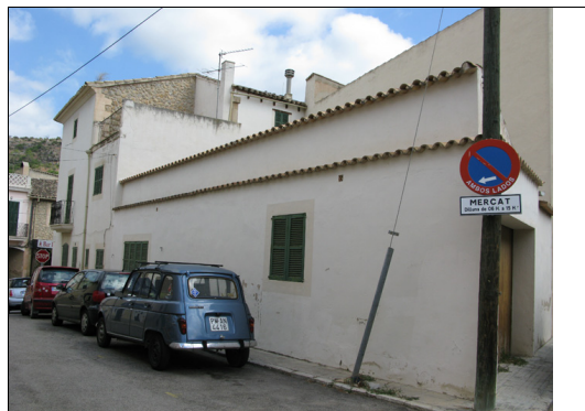
Descripción: Fachada lateral situada en la c/ Nissagues formada por el cuerpo principal y dos cuerpos anejos, el primero adosado a la fachada posterior del cuerpo principal, que consta de tres plantas, aunque la mitad de la superior está ocupada por una terraza. El siguiente cuerpo tiene sólo una altura y un garaje en la parte posterior.