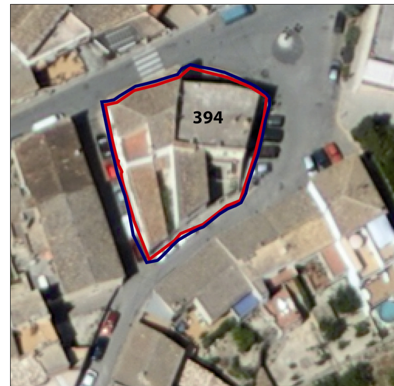
Delimitación del conjunto