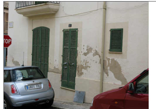
Descripción: Desperfectos en la planta baja del muro lateral causado por la humedad y que ha provocado desconchones en la pintura. También hay desperfectos en las persianas que cierran los vanos.