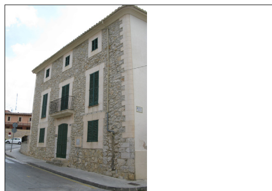
Descripción: Fachada principal situada en la c/ Major. El conjunto presenta tres alturas con filas de tres vanos alineados. El tercio inferior del muro se adapta a la pendiente de la calle, siendo más larga en el extremo derecho.