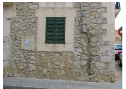
Descripción: Suciedad en el muro causado por que la bajante está fuera de su lugar.