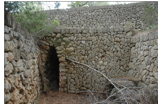
Descripción 070-3: Detalle escalera de acceso al pasillo de marges.