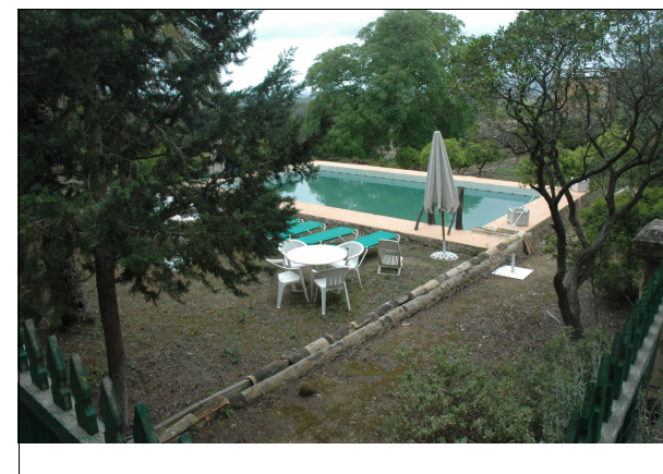
Descripción: Vista del recorrido de la canalización. Piscina (antiguo aljibe).