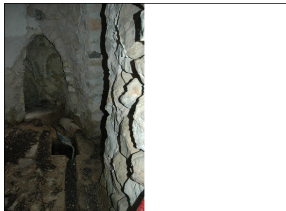
Descripción: 070-1: Interior de la galería de la font de mina con abertura sellada del punto de captación de agua.