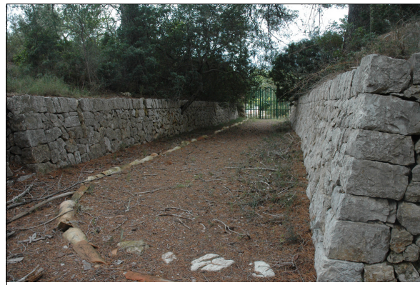
Descripción: 070-1, 070-2: Vista general del segundo tramo del pasillo de bancales, con canaleta.