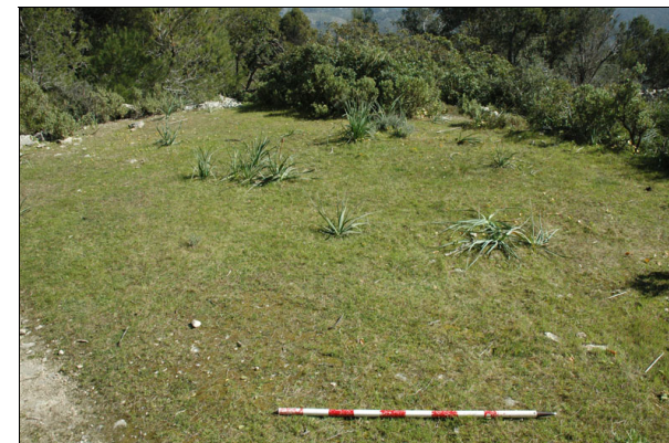
Descripción: Vista general de la era