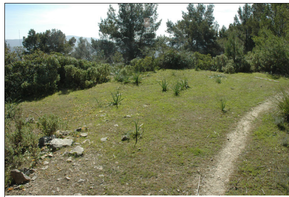
Descripción: Camino que atraviesa la era.