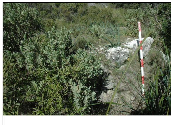
Descripción: Muro de la era.