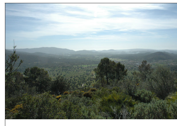
Descripción: Visibilidad desde la era.