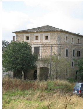
Descripción: Vivienda de tres plantas situada en la c/ Es Pontet. Muros de mampostería con vanos y arcos de arenisca. Cubierta inclinada de cuatro vertientes con teja árabe.