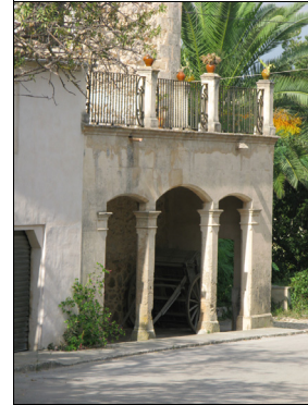
Descripción: Porche situado en la parte delantera de la vivienda que consta de tres arcos escarzanos, siendo el central más alto y ancho que los laterales. Sobre el porche una terraza que cierra mediante pilares cuadrados y reja de hierro forjado.