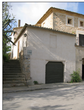
Descripción: Cuerpo de dos pisos, en el lateral de la vivienda principal que corresponde a un garaje y una habitación en el piso superior. Junto al cuerpo una escalera que permite acceder a la fachada lateral y posterior del conjunto