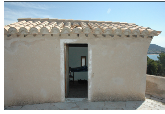
Descripción: Imagen de la estancia anexa en el cuerpo superior de la torre.