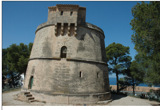
Descripción: Vista general de la torre, antiguo acceso, construcción en el cuerpo superior, aspilleros y acceso actual con escaleras.