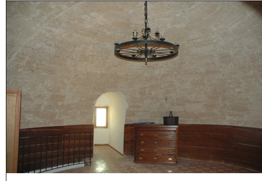
Descripción: Sala abovedada del piso superior.