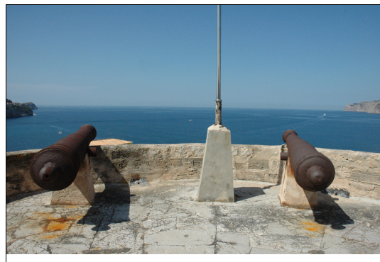
Descripción: Cubierta transitable de la torre con pavimento pétreo, cañones, y control visual de la entrada a la Bahía de Santa Ponsa.