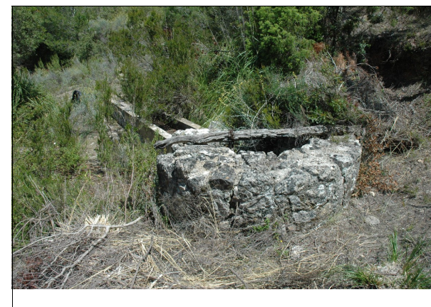
Descripción: Cintell del pozo