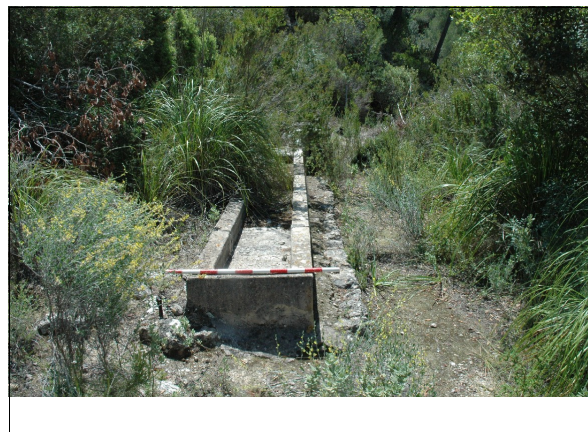
Descripción: Abrevadero rectangular.