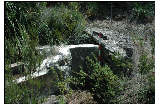
Descripción: Losa calcárea ubicada en el cintell que da un punto de acceso al pozo y punto de unión entre el pozo y el abrevadero.