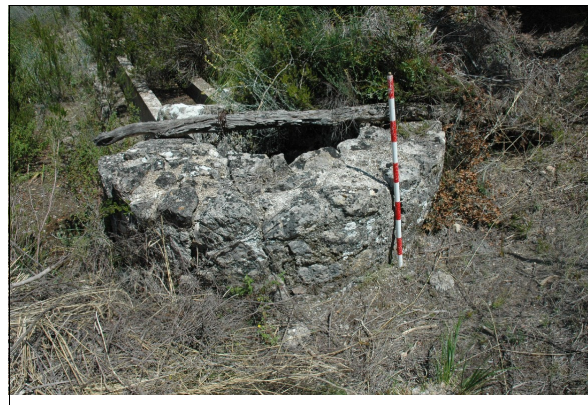
Descripción: Vista general del conjunto