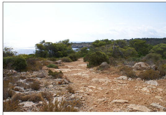
Descripción: Vista del camino