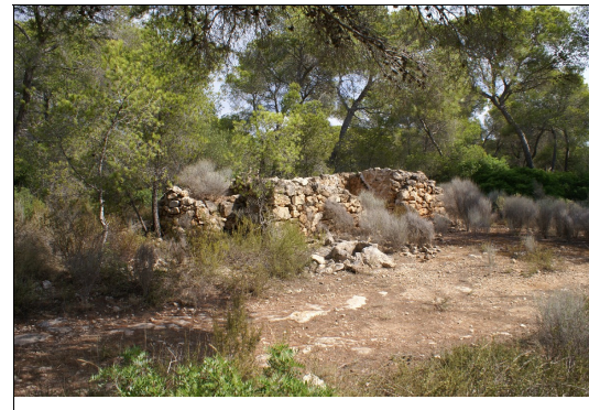
Descripción: Caseta de roter en el camino