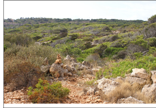
Descripción: Hito del sendero