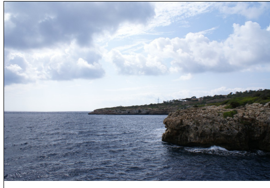
Descripción: Cala beltrán