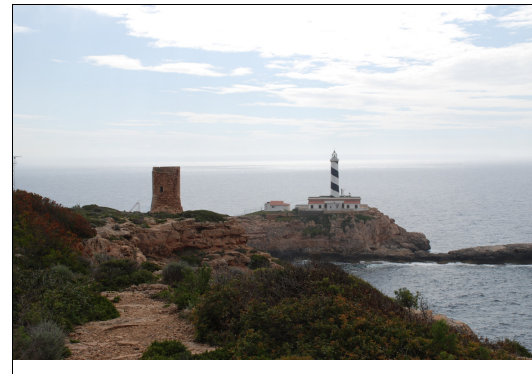
Descripción: Ubicación de la torre.