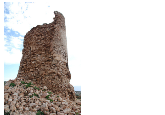
Descripción: Vertiente sur de la torre en avanzado estado de degradación.