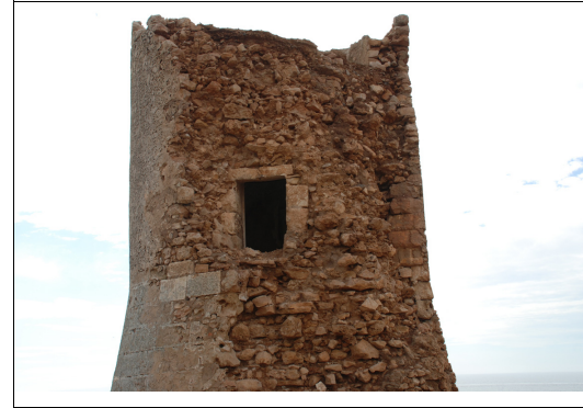
Descripción: Puerta de acceso a media altura y muro muy degradado.