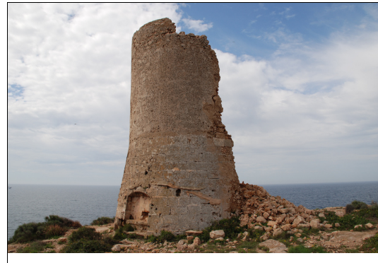
Descripción: Vista de la torre en su lado mejor conservado.