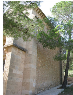
Descripción: Muro lateral derecho. Se pueden ver los contrafuertes, la galería de ventanas en el tercio superior y las ménsulas que sujetan el alero del tejado.