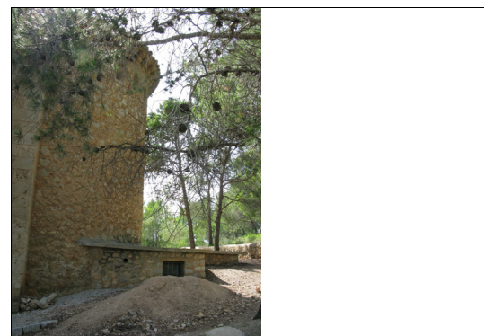
Descripción: Ábside y caseta.