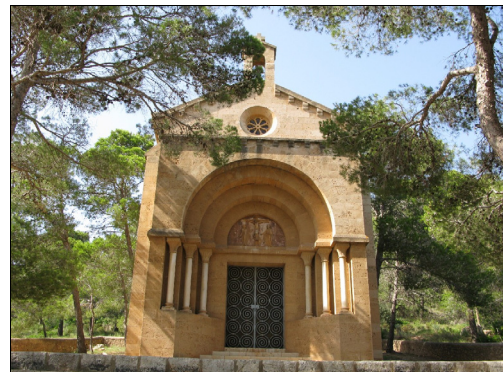
Descripción: Fachada principal del oratorio. Relieve del tímpano de la fachada que representa a Cristo crucificado con las tres Marías.