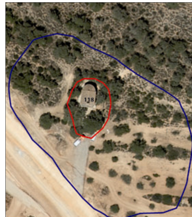
Delimitación del conjunto