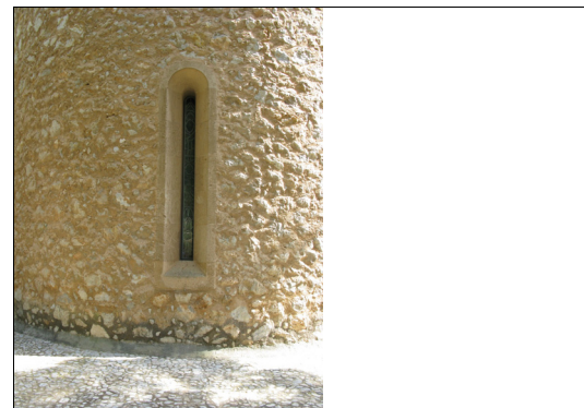
Descripción: Ventana aspillera del ábside