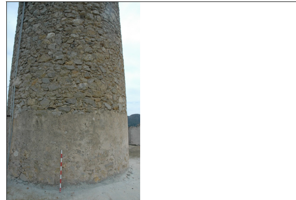
Técnicas constructivas utilizadas en la torre.