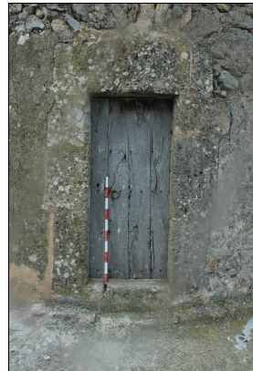
Puerta de acceso a la torre del molino.