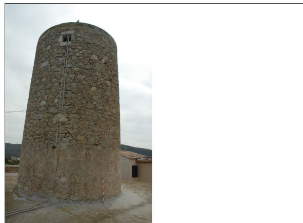
Vista posterior del molino.