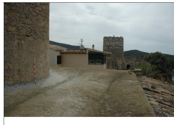
Cubierta del cintell abovedada y revestida, al fondo molí vell (81).