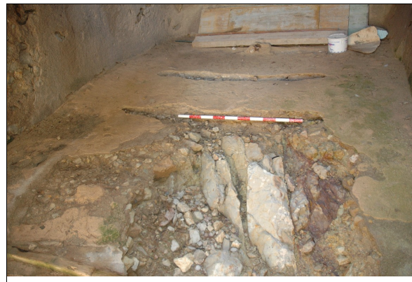
Descripción 279-1: Detalle del pavimento de la mitad posterior del varadero