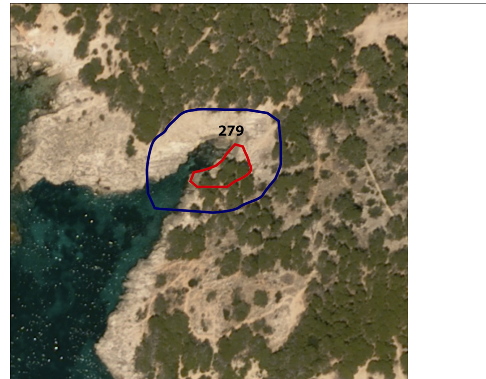
Delimitación del conjunto