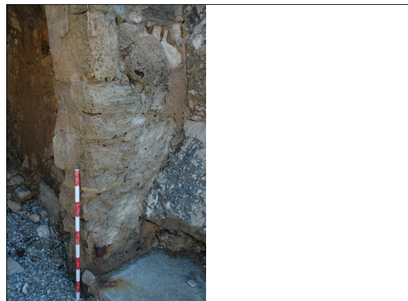
Descripción 279-1: Detalle de la jamba derecha de la puerta del varadero.