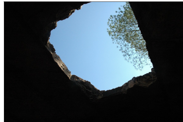
Descripción 279-1: Detalle del agujero de la cubierta, visto desde el interior.