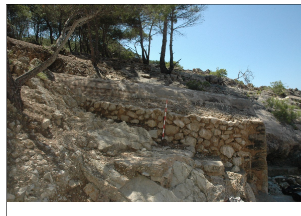
Descripción 279-1: Vista lateral del exterior del varadero.