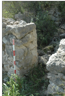
Descripción Puerta de acceso y los revestimientos de la misma