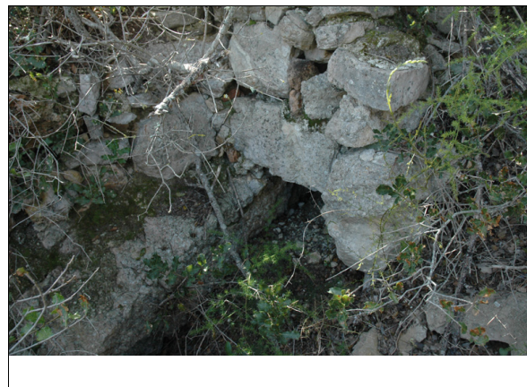
Descripción: Foto del nicho ubicado en la pared trasera.