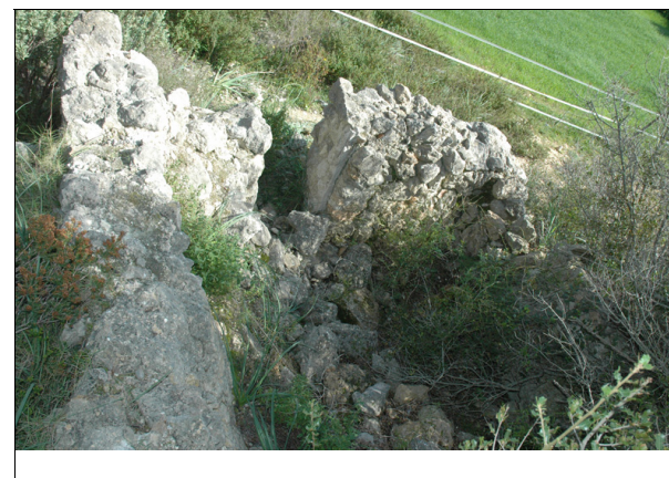
Descripción: Foto de la barraca desde el interior.