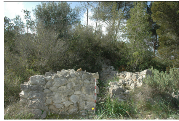
Descripción: Vista de la fachada de la barraca y su puerta de acceso.