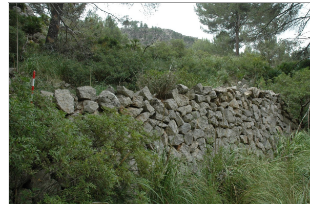
Descripción 286-1: Pared exterior.