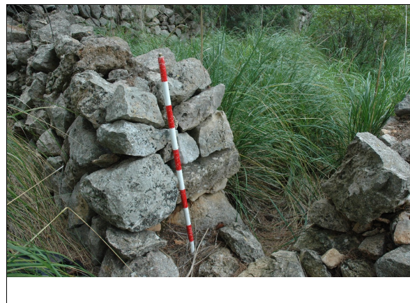
Descripción 286-1: Detalle del vano de ingreso.