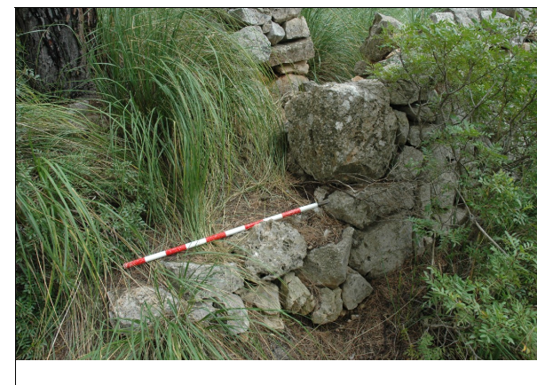
Descripción 286-1: Detalle rampa de acceso.