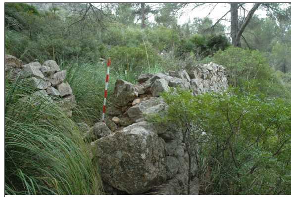
Descripción 286-1: Vista del sesteadero desde arriba.