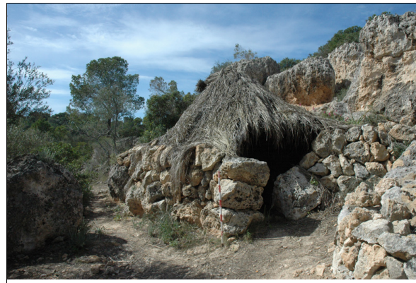
Descripción: Foto de la barraca.