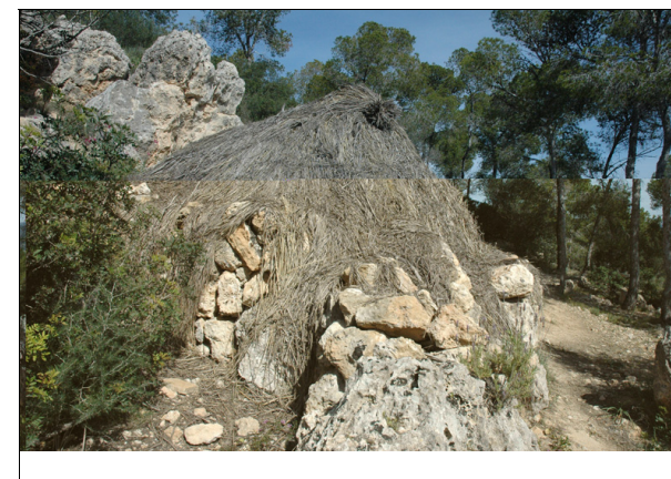
Descripción: Vista trasera de la barraca.