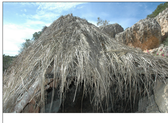
Descripción: Cubierta vegetal de la caseta.