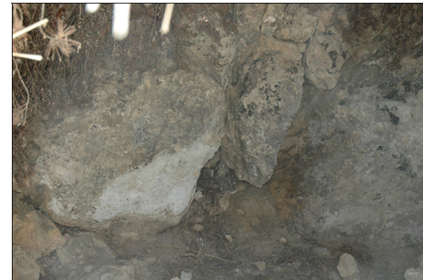
Descripción: Vista del muro desde el interior.