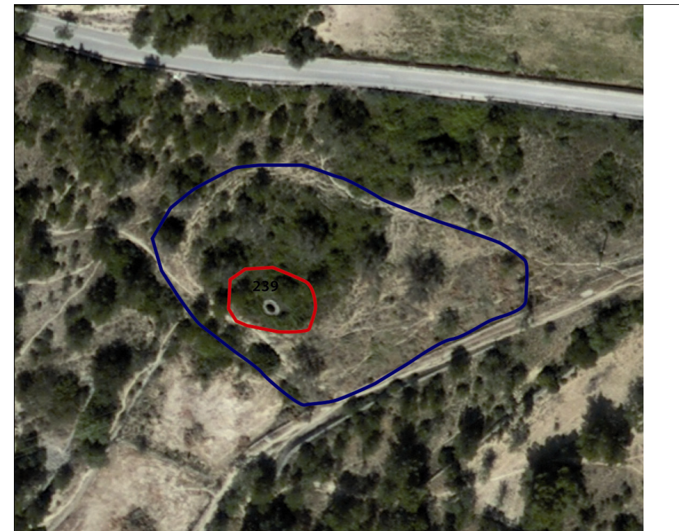
Delimitación del conjunto