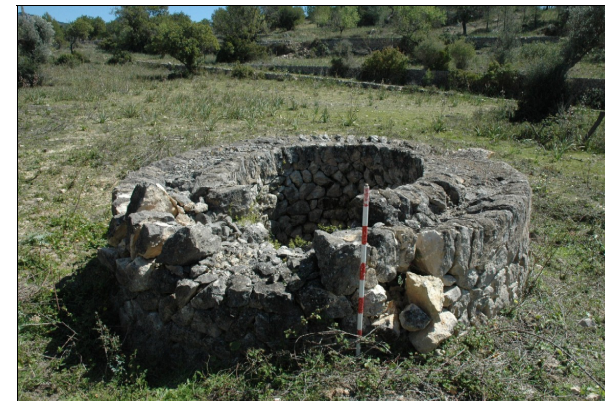
Zona degradada del cintell del pozo.