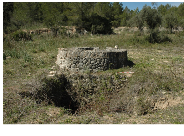
Vista general del conjunto.