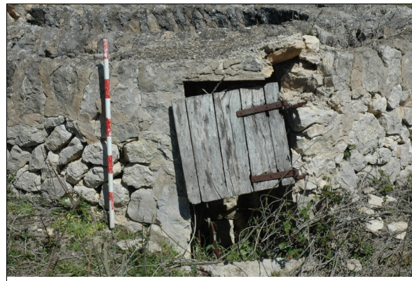
Puerta de acceso al pozo en el cintell.